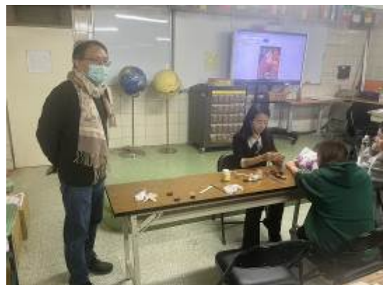
拍照日期：114 年 12 月 3 日 照片說明：任課老師引導實施實作課程