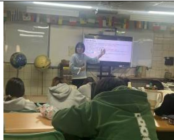
拍照日期：114年11月12日 照片說明：羅老師說明違規食品廣告