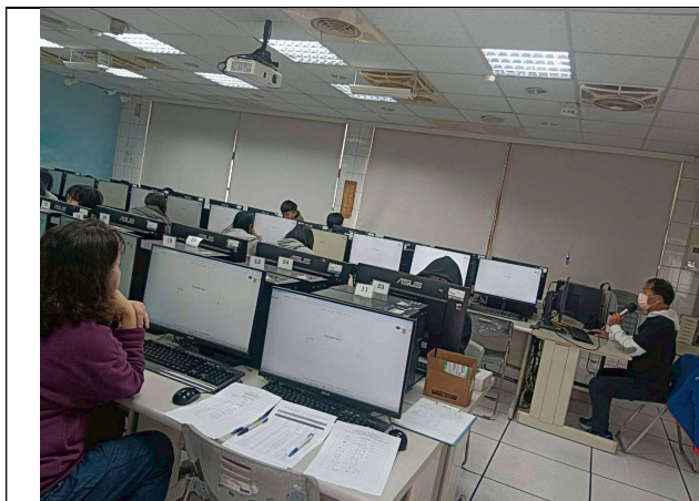
拍照日期：114年12月03日 照片說明：指導 TA 下載上課素材。