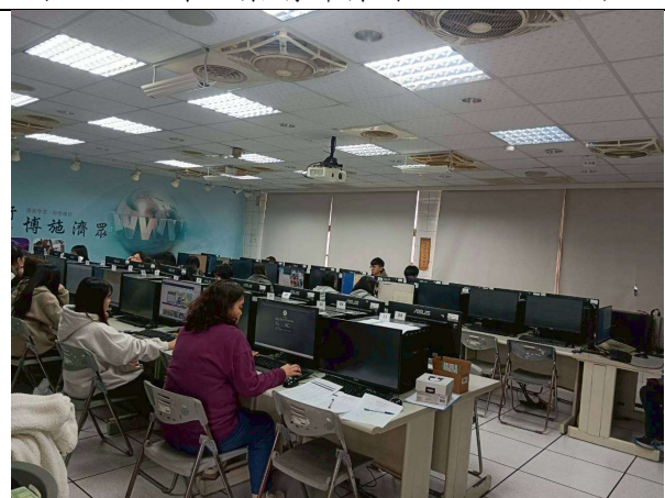
拍照日期：114年12月03日 照片說明：教學助理實際練習中。