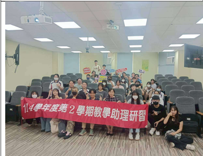
拍照日期：114年10月08日 照片說明：教學助理與督導老師大合照。