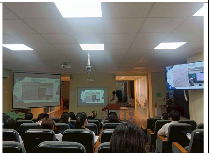
拍照日期：114年10月08日 照片說明：績優 TA 經驗分享