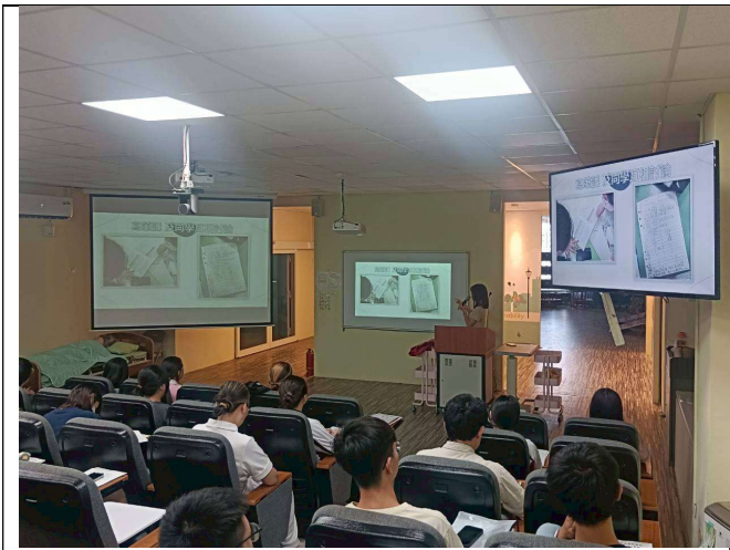
拍照日期：114年10月08日 照片說明：績優 TA 經驗分享。