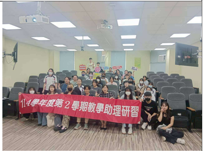
拍照日期：114年10月08日 照片說明：教學助理與督導老師大合照。