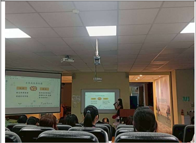
拍照日期：114年10月08日 照片說明：績優 TA 經驗分享