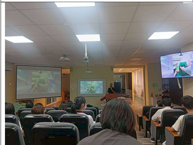
拍照日期：114年10月08日 照片說明：績優 TA 經驗分享