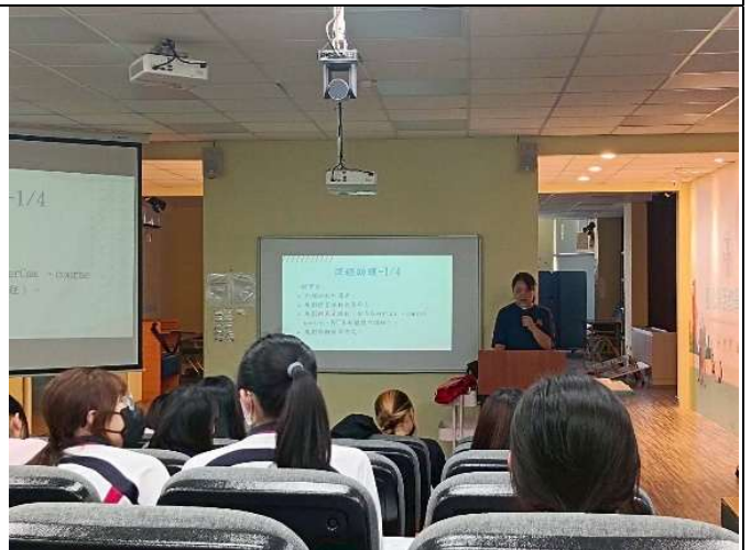
拍照日期：114年10月08日 照片說明：教學助理業務說明。