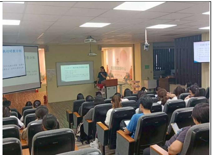
拍照日期：114年10月08日 照片說明：教學助理業務說明。