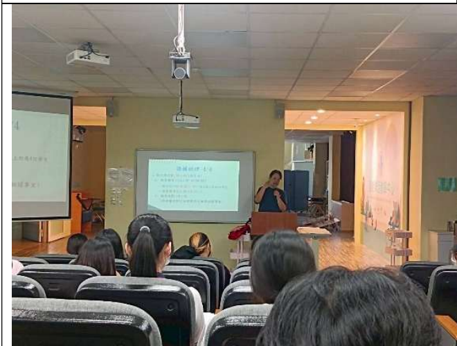
拍照日期：114年10月08日 照片說明：教學助理業務說明。