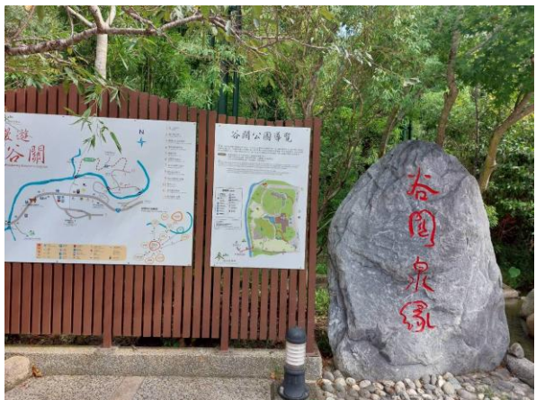
拍照日期：114年9月3日 照片說明：捎來步道路線圖與起點