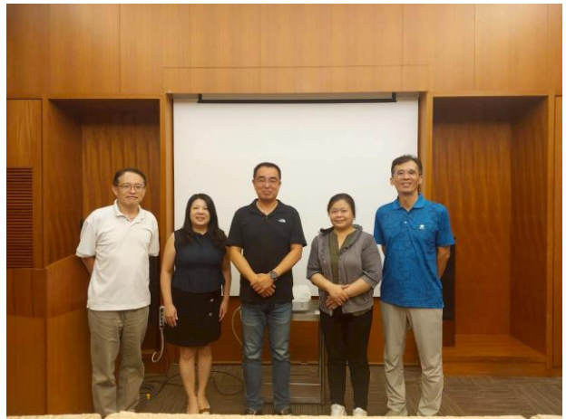
拍照日期：114年9月2日 照片說明：授課老師與研習老師合影