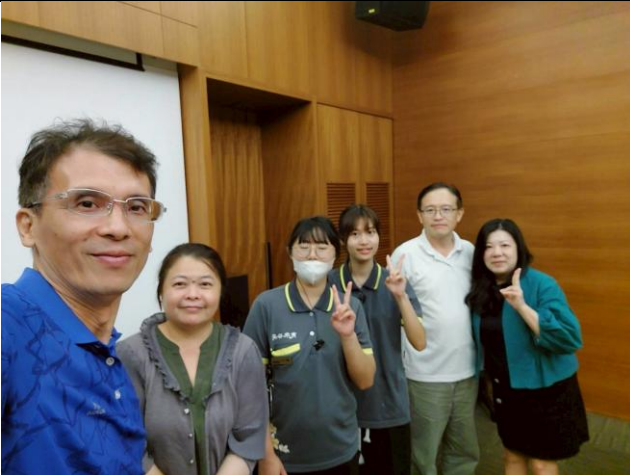
拍照日期：114年9月2日 照片說明：授課教師與留任機構之畢業生合影