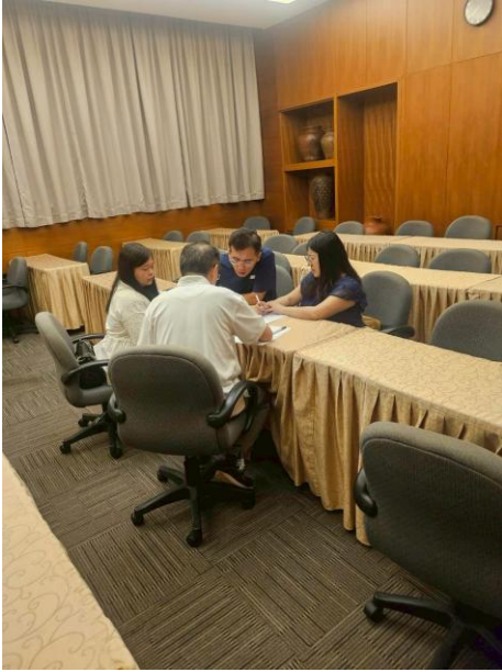
拍照日期：114年9月2日 照片說明：研習老師進行討論