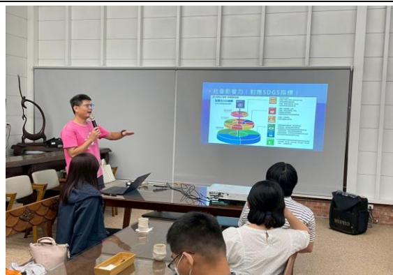
拍照日期：114.09.12 照片說明：講師講解海線一家親環保協會落實在 SDGs 指標及社會影響力