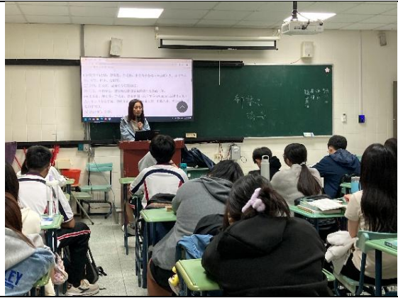
拍照日期：11月17日15:10-16:00 照片說明：講解世說新語課文-5N101