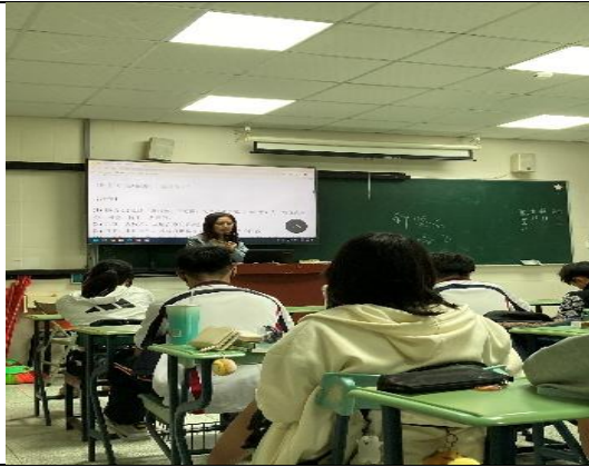
拍照日期：11月17日15:10-16:00 照片說明：講解世說新語課文-5N101