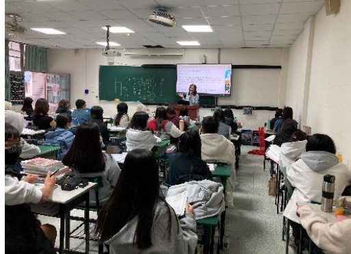
拍照日期：11月18日15:10-16:00 照片說明：講解世說新語課文-5N103