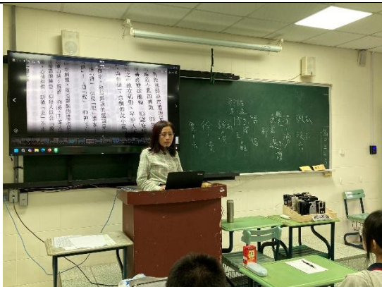
拍照日期：11月20日11:10-12:00 照片說明：講解世說新語課文-50101