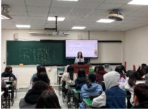
拍照日期：11月18日15:10-16:00 照片說明：講解世說新語課文-5N103