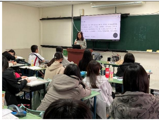
拍照日期：11月20日11:10-12:00 照片說明：練習世說新語測驗-50101