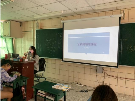
拍照日期：12/13 照片說明：如何與患者有效溝通-同理心