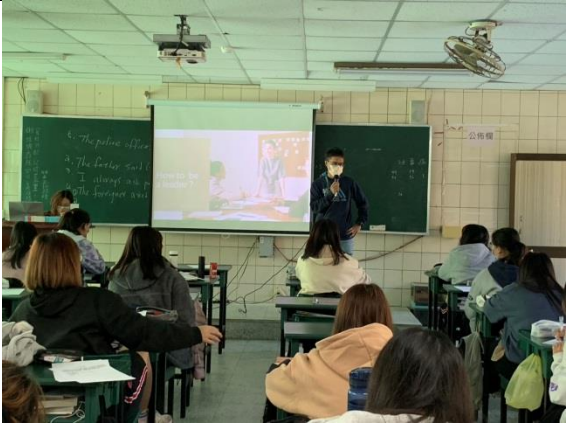
拍照日期：11/22 照片說明：牙科診間溝通與管理-領導統御