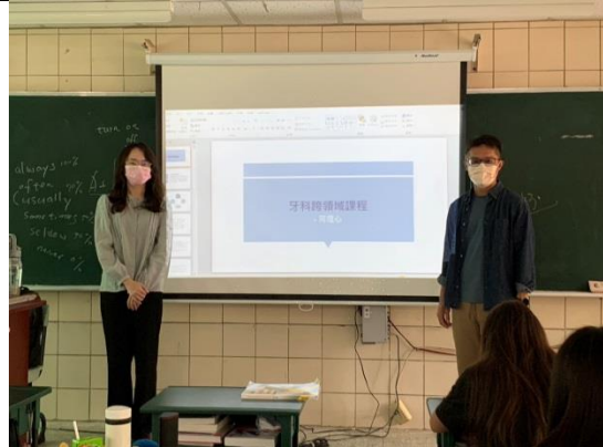
拍照日期：12/13 照片說明：如何與患者有效溝通-同理心