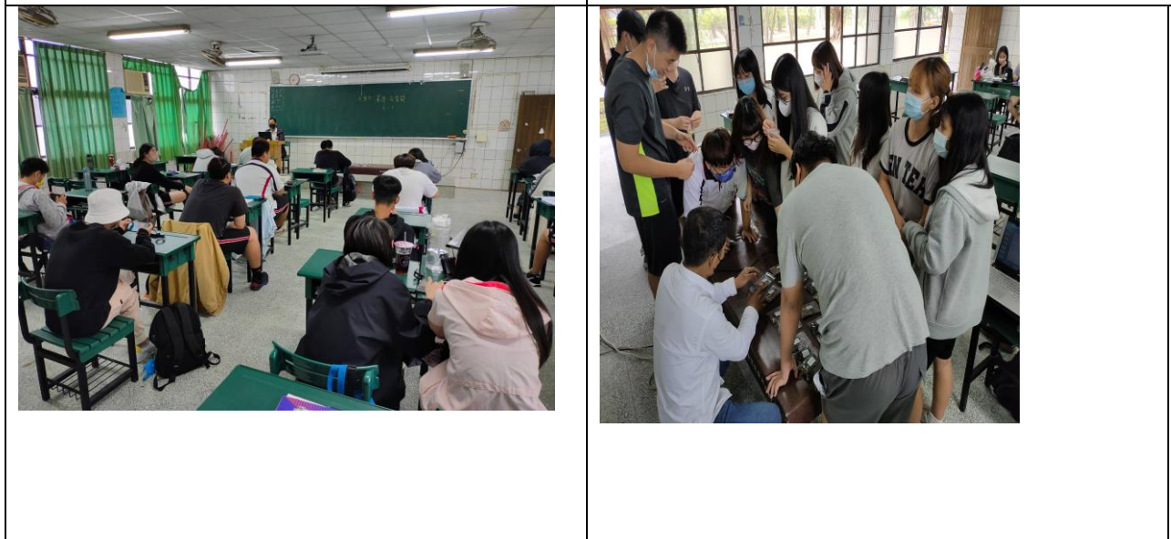
拍照日期：111年5月2日 照片說明：業師講解溫裡藥功用辨識鑑別 拍照日期：111年5月9日 照片說明：業師講解理氣藥功用辨識鑑別