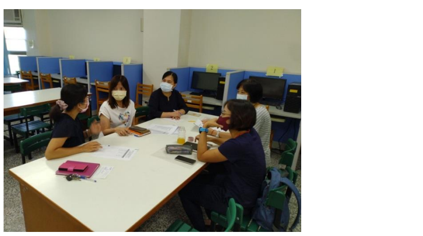
拍照日期：111.9.23 照片說明：專家進行基護 OSCE 教案專家諮詢