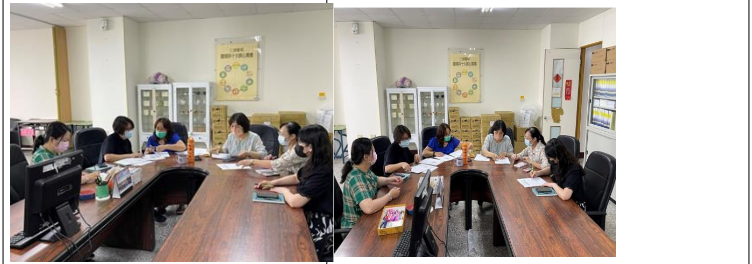
拍照日期：111.9.7 照片說明：專家進行內外科 OSCE 教案專家諮詢 拍照日期：111.9.7 照片說明：專家進行內外科 OSCE 教案專家諮詢