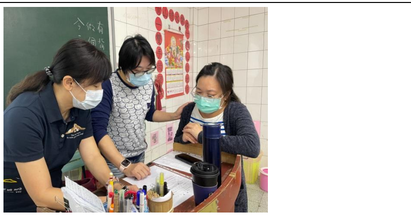
拍照日期：111.9.22 照片說明：專家進行精神科 OSCE 教案專家諮詢