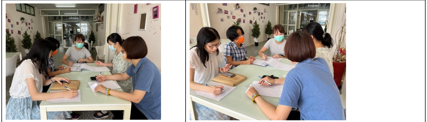
拍照日期：111.9.14 照片說明：專家進行社區 OSCE 教案專家諮詢 拍照日期：111.9.14 照片說明：專家進行社區 OSCE 教案專家諮詢