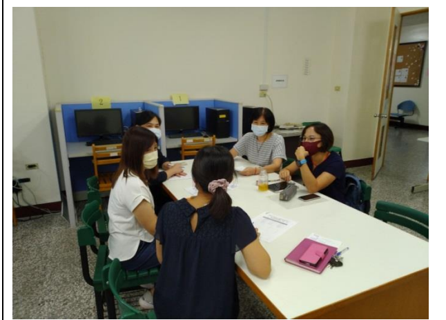
拍照日期：111.9.22 照片說明：專家進行精神科 OSCE 教案專家諮詢