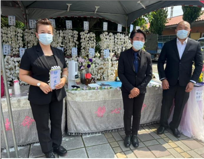
拍照日期：111/5/5 照片說明：學生桃園靜心生命禮儀服務實習