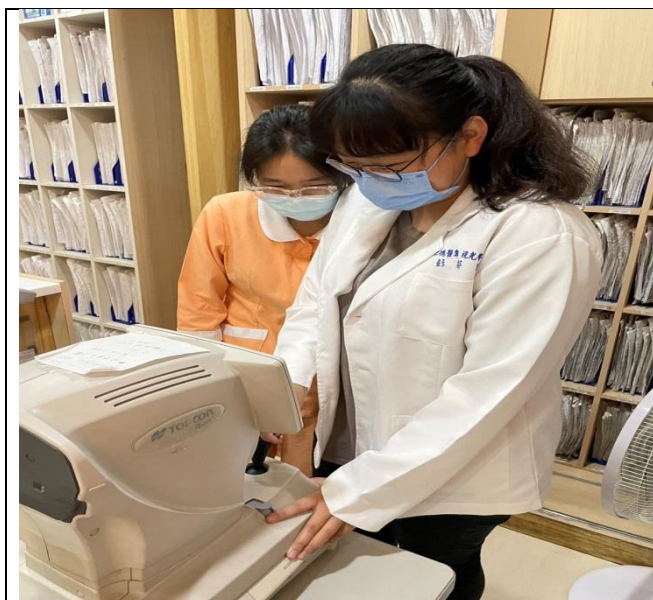
拍照日期：111年11月27日照片 說明：上明眼科(實習指導)