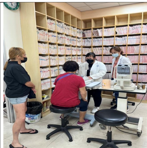
拍照日期：111年10月18日照片 說明：豐安眼科(實習指導)