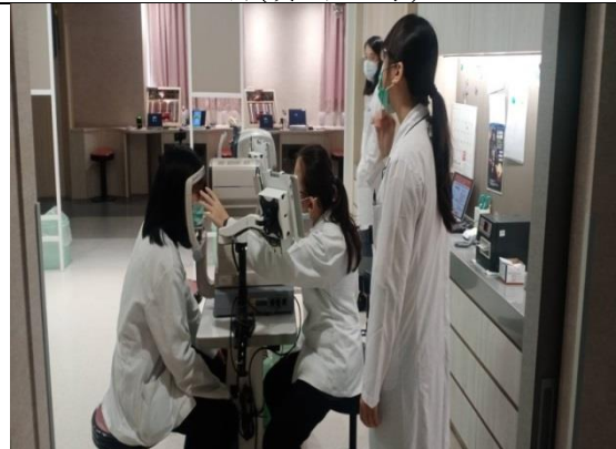
拍照日期：111 年 11 月 17 日照片 說明：彰化基督教醫院(實習指導)