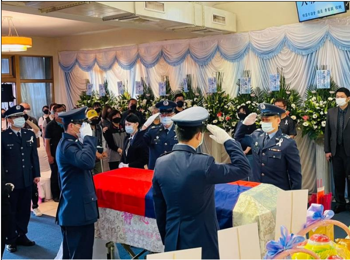
拍照日期：111/5/5 照片說明：學生桃園靜心生命禮儀服務實習