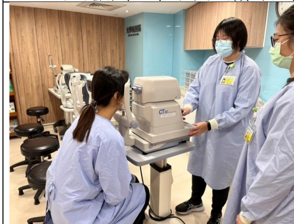
拍照日期：111 年 11 月 11 日照片 說明：秀傳紀念醫院(實習指導)