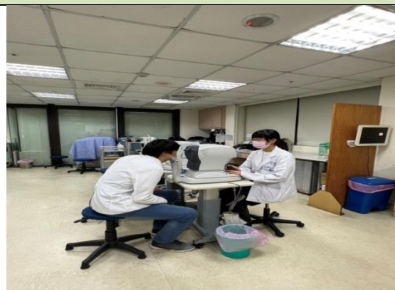
拍照日期：111 年 11 月 03 日照片 說明：光田綜合醫院(實習指導)