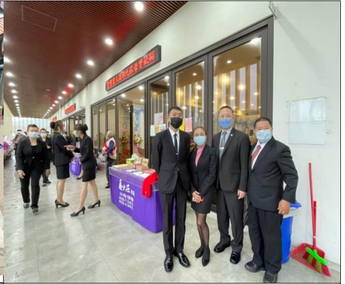
拍照日期：110/4/9 照片說明：學生苗栗鑫大庄實習現況