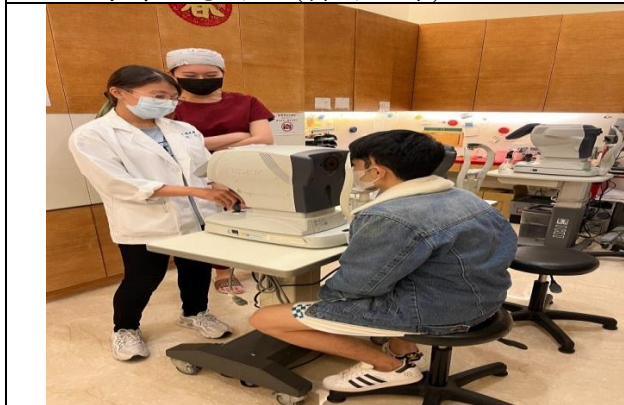
拍照日期：111 年 11 月 3 日照片 說明：第一明眼科(實習指導)