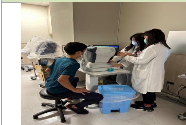
拍照日期：111 年 10 月 24 日照片 說明：中國醫藥學大學新竹分院(實習指導)