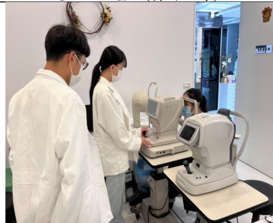
拍照日期：111 年 11 月 11 日照片 說明：世紀眼科(實習指導)