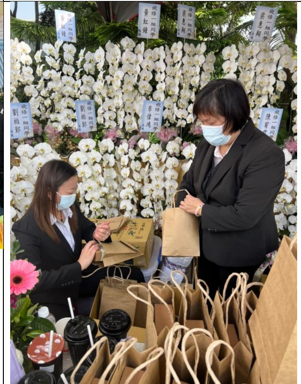
拍照日期：110/4/25 照片說明：桃園光祥生命禮儀服務學生校外實習