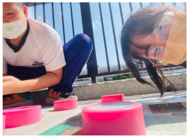
拍照日期：111 年 3 月 9 日 照片說明：同學們正在期待石膏凝固