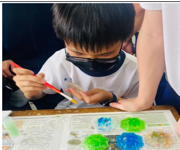
拍照日期：111 年 3 月 16 日 照片說明：將凝固脫模的香氛琉璃皂刷上一層薄薄的金色粉增添琉璃皂質感