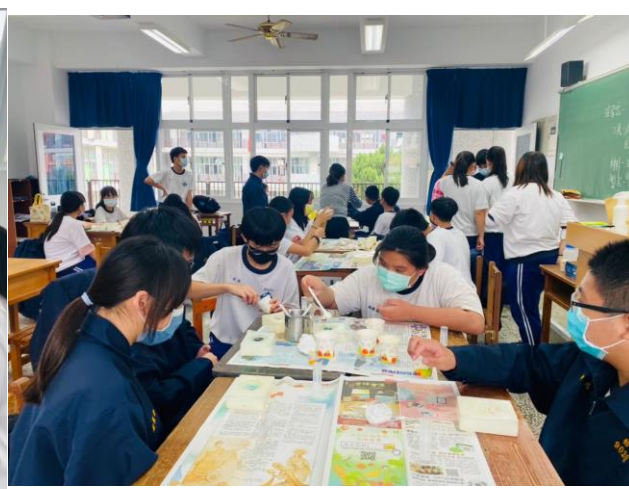
拍照日期：111年3月16日 照片說明：透過不同色彩的皂液分次入模創作香氛手工皂之色彩層次感