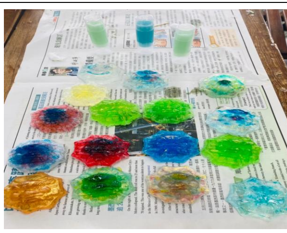
拍照日期：111 年 3 月 16 日 照片說明：各組完成香氛琉璃手工皂並展示成果與分享心得