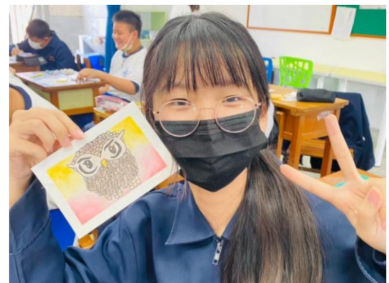
拍照日期：111 年 3 月 2 日 照片說明：學生作品欣賞與分享