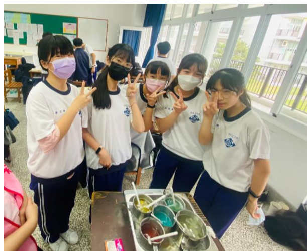
拍照日期：111年3月16日 照片說明：老師示範與說明今天主題香氛手工皂創作流程