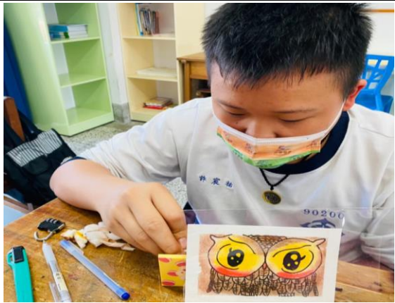
拍照日期：111 年 3 月 2 日 照片說明：以眼影上色技法練習彩繪漸層創造眼部色彩