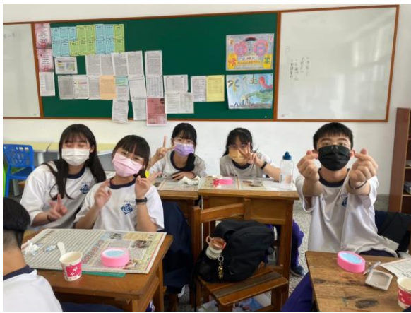
拍照日期：111 年 3 月 9 日 照片說明：將正確的石膏粉與水調和均勻後倒入天使模具中期待石膏凝固