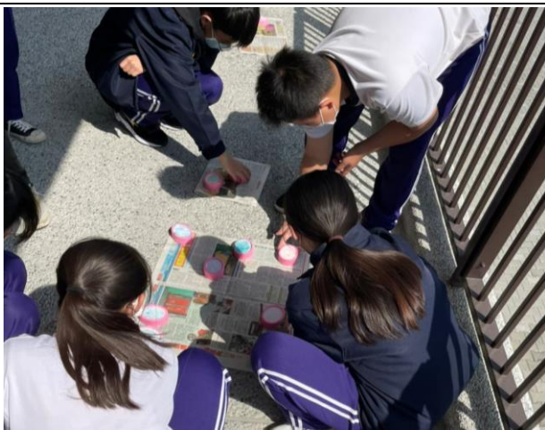
拍照日期：111 年 3 月 9 日 照片說明：觀察石膏凝固狀是否存在體積膨脹