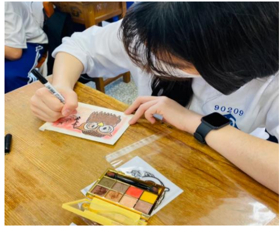
拍照日期：111 年 3 月 2 日 照片說明：以唇形科植物薰衣草彩繪做妝飾