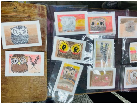
拍照日期：111 年 3 月 2 日 照片說明：學生作品欣賞