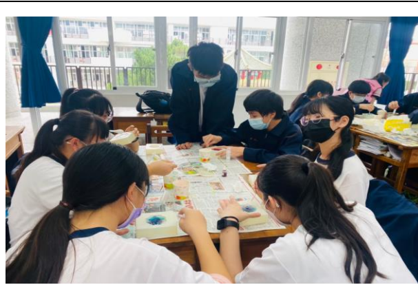
拍照日期：111 年 3 月 16 日 照片說明：將調完專屬香氣與色彩的皂體入模等候皂液凝固