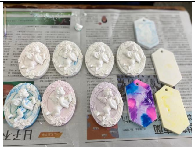
拍照日期：111 年 3 月 9 日 照片說明：天使香氛擴香石脫模成功