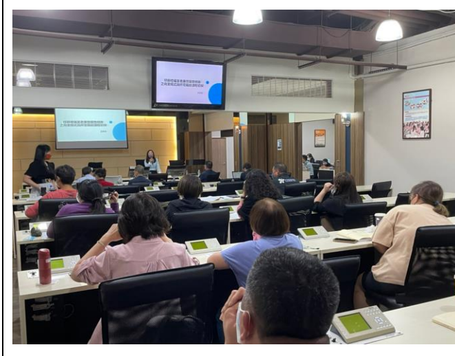
拍照日期：111.9.25 照片說明：會議情況