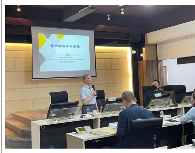
拍照日期：111.9.25 照片說明：尉遲淦教授發表專題講座