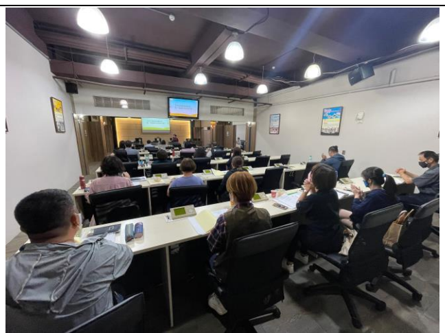
拍照日期：111.9.25 照片說明：會議現場

六 成效分析(含質化成果及量化成果)： 生命關懷殯葬與寵物研習及遺體美容與修復研習活動，邀請殯葬業界、專家學者共同撰寫論文。