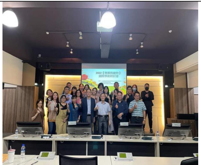
拍照日期：111.9.25 照片說明：會議成員合影