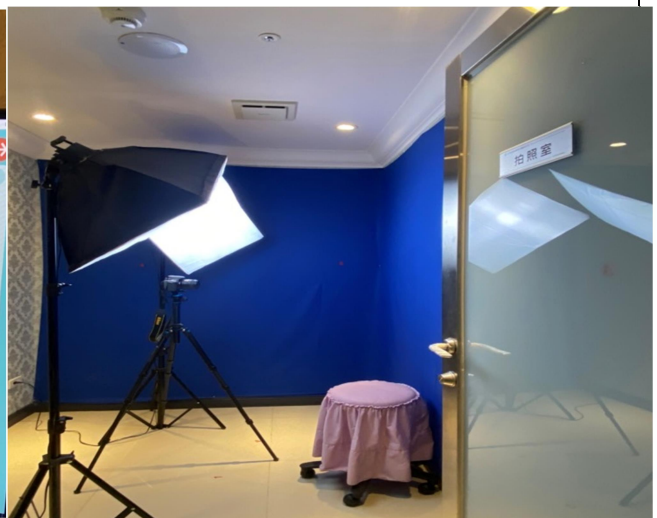
執行醫美療程前的專業拍照攝影室