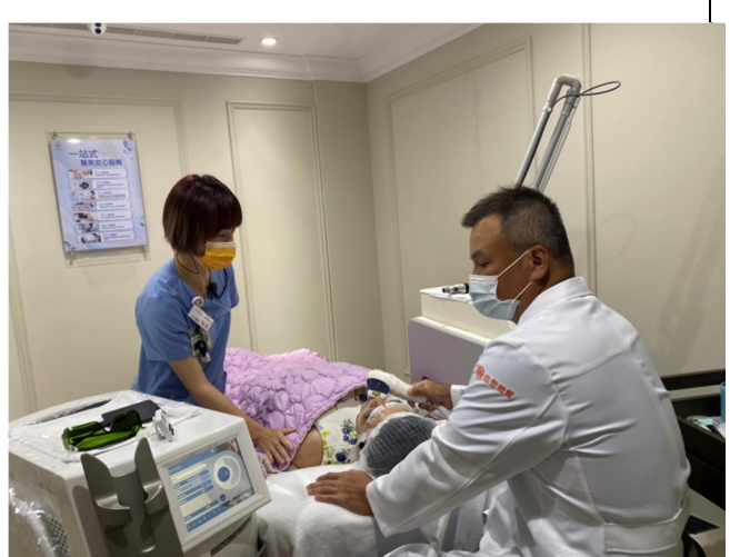
醫師執行雷射治療與醫美師輔助服務流程講解