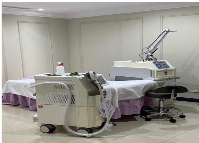
診間環境規劃與新一代光電類儀器設備