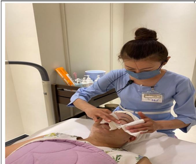
醫美師於診間進行雷射前的輔助醫療準備