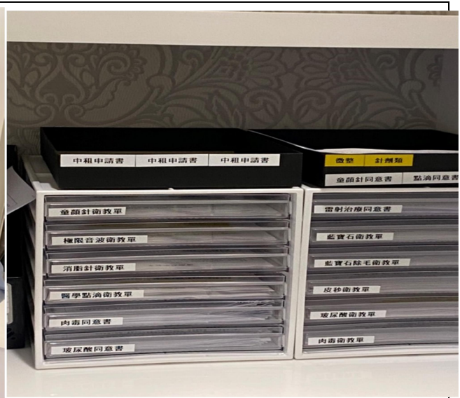
各項醫美服務項目的顧客衛教資料建檔