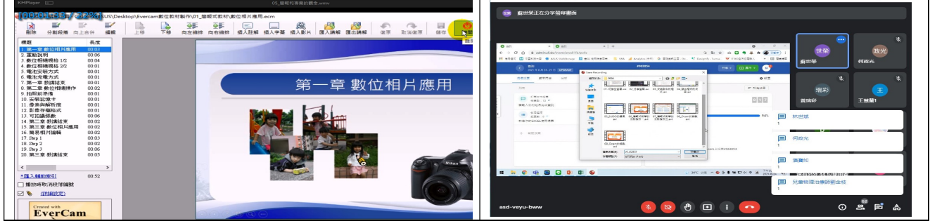
拍照日期：110年08月25日 照片說明：蘇世榮老師講解專案擋與簡報擋差異與觀念釐清。 拍照日期：110年08月25日 照片說明：蘇老師贈送仁德醫專老師簡報佈景主題，並說明其套用與儲存方式。