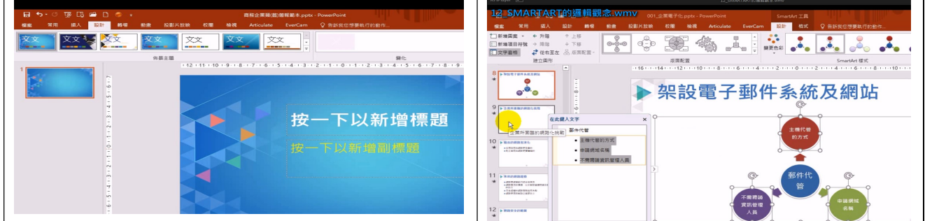
拍照日期：110年08月25日 照片說明：蘇老師說明清除手動美化的效果。 拍照日期：110年08月25日 照片說明：說明簡報擋 SMARTART 的邏輯觀念。