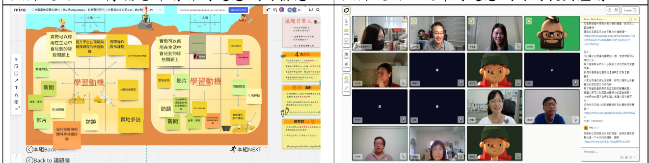
拍照日期：110年08月23日 照片說明：拆解有效教學方法與策略。