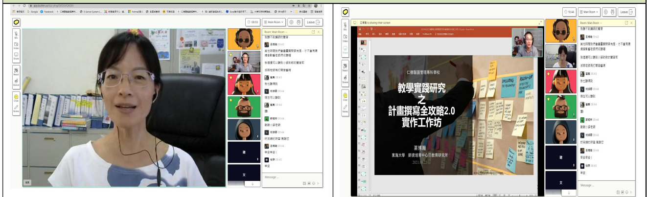
拍照日期：110年08月23日 照片說明：仁德醫專教務主任開場致詞。