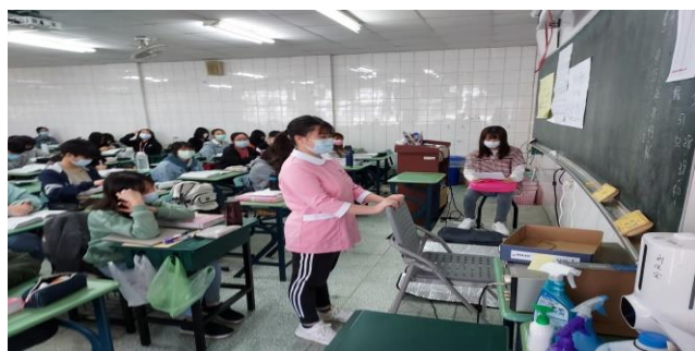
拍照日期：110 年 11 月 12 日 13:00-15:00 照片說明：護理師示範給個案了解