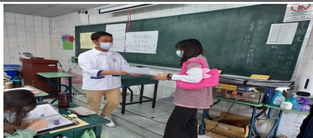
拍照日期：110 年 11 月 12 日 13:00-15:00 照片說明：護理師與個案互動