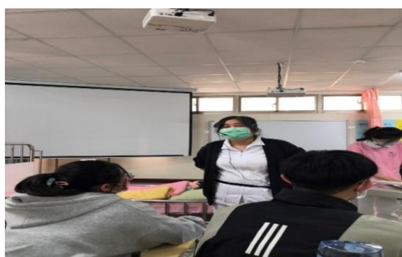
拍照日期：110. 11. 10 照片說明：老師向同學說明黃疸評估與照光治療護理指導情境教案操作過程及注意事項