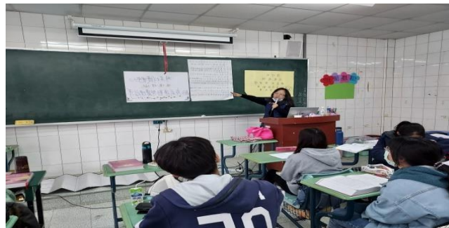
拍照日期：110 年 11 月 12 日 13:00-15:00 照片說明：告知本課程情境模擬主題與任務