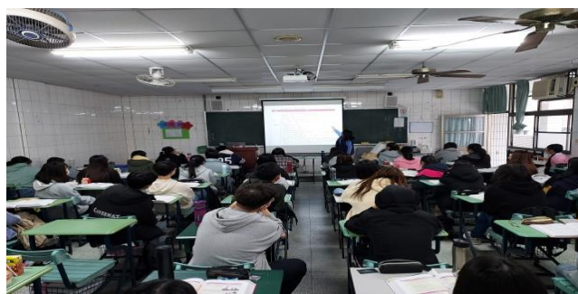
拍照日期：110 年 11 月 12 日 13:00-15:00 照片說明：教導複習產前運動與護理指導技術