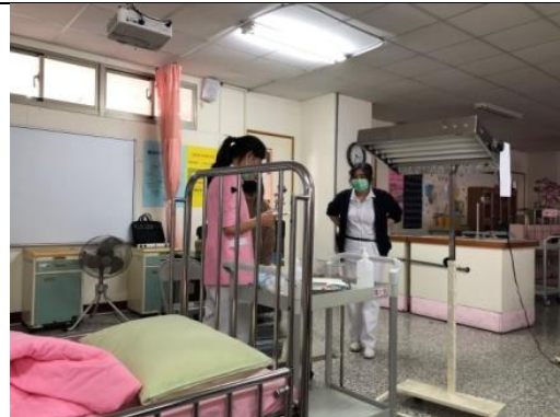
拍照日期：110. 11. 10 照片說明：同學進行情境教學演練