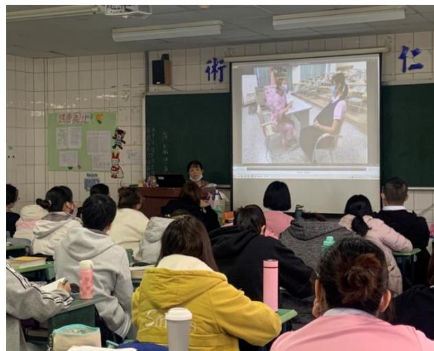
拍照日期：110. 12. 03 照片說明：以預拍之情境影片進行情境教學