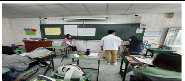
拍照日期：110 年 11 月 12 日 13:00-15:00 照片說明：護理師準備環境