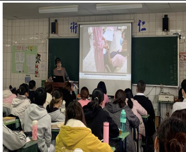
拍照日期：110. 12. 03 照片說明：以預拍之情境影片進行情境教學