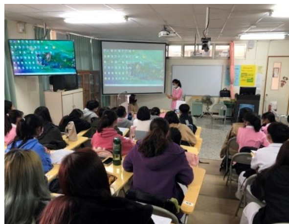
拍照日期：110. 11. 10 照片說明：同學進行情境教學演練