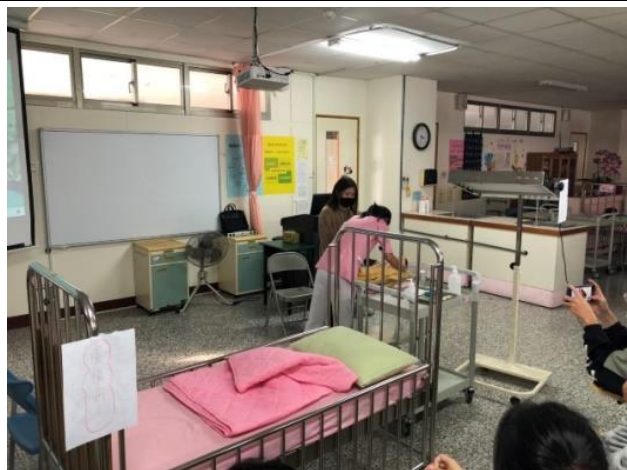
拍照日期：110. 11. 10 照片說明：同學進行情境教學演練