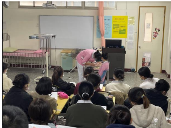
拍照日期：110.11.11 照片說明：模擬學習者與標準病人情境教案演練過程 -2