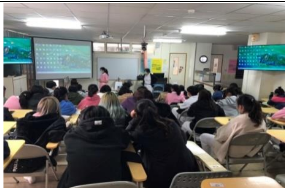
拍照日期：110. 11. 10 照片說明：同學進行情境教學演練