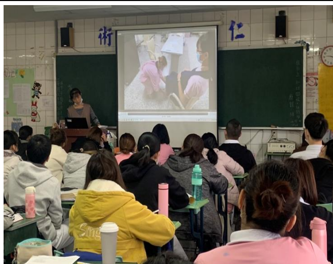
拍照日期：110. 12. 03 照片說明：以預拍之情境影片進行情境教學