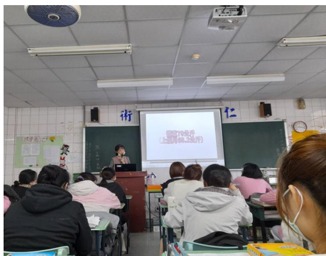
拍照日期：110. 12. 03 照片說明：以預拍之情境影片進行情境教學