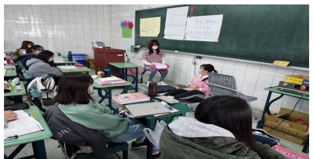
拍照日期：110 年 11 月 12 日 13:00-15:00 照片說明：護理師示範給個案了解