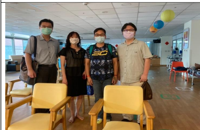
拍照日期：110年9月29日 照片說明：參訪社區餐廳與教學廚房