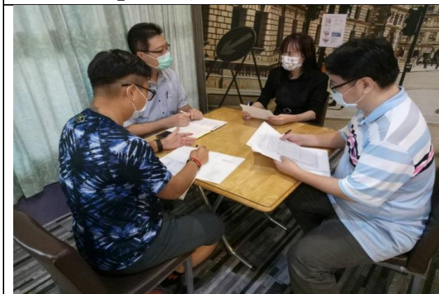
拍照日期：110年10月6日 照片說明：社區C據點高齡運動現況的分享