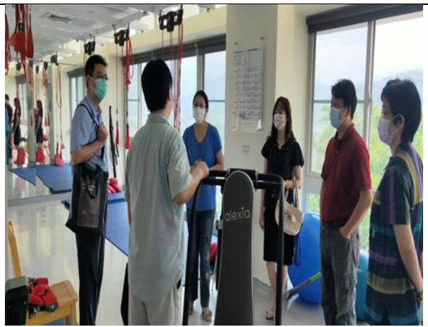
拍照日期：110年9月29日 照片說明：參訪樂齡健康復健中心