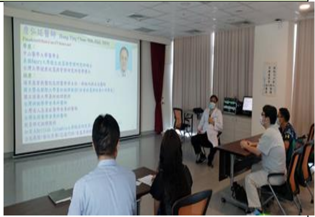
拍照日期：110年9月29日 照片說明：講演落實在地之長照服務模式