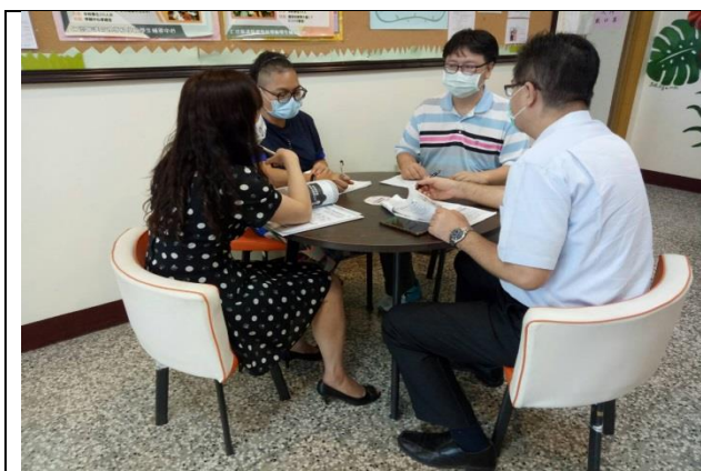
拍照日期：110年10月1日 照片說明：社區整合型服務中心(A)的分享