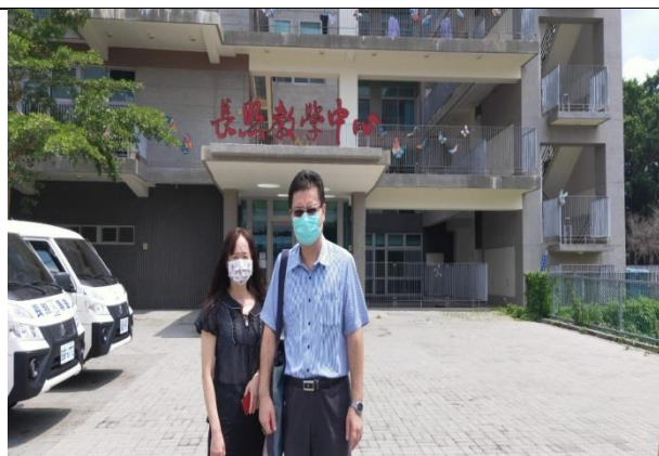
拍照日期：110年9月29日 照片說明：長照中心大樓外貌