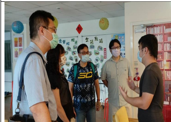
拍照日期：110年9月29日 照片說明：參訪日照中心