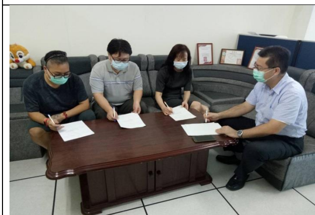
拍照日期：110年10月5日 照片說明：「複合型服務中心(B)」與「巷弄長照站(C)」的分享