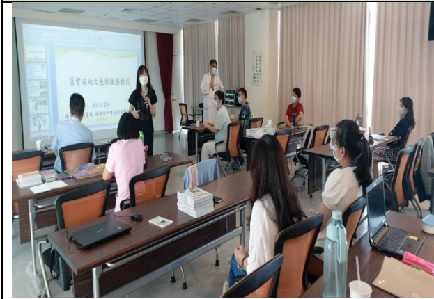
拍照日期：110年9月29日 照片說明：科主任介紹本科同仁