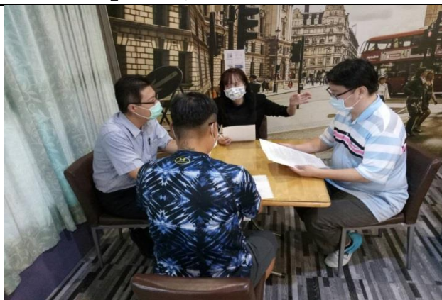
拍照日期：110年10月6日 照片說明：社區C據點高齡運動現況的分享