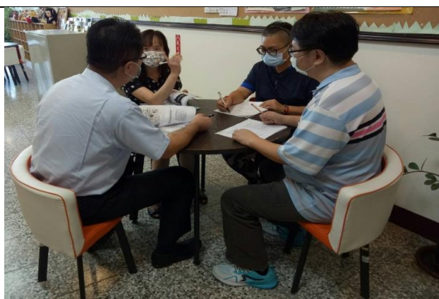
拍照日期：110年10月1日 照片說明：社區整合型服務中心(A)的分享