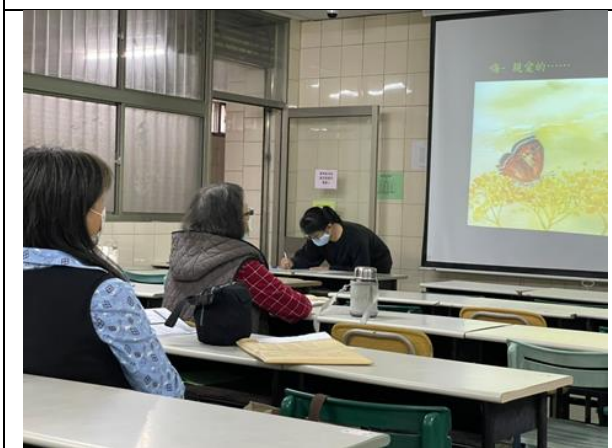
拍照日期：1101116 照片說明：栩栩如生的畫作中，重新認識、驚艷她的蛻變與美麗。