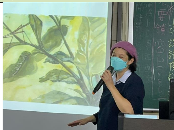
拍照日期：1101116 照片說明：從畫作中，帶著讀者一起想像昆蟲動物世界，牠們的生活環境，是很棒的環境教育啟蒙。