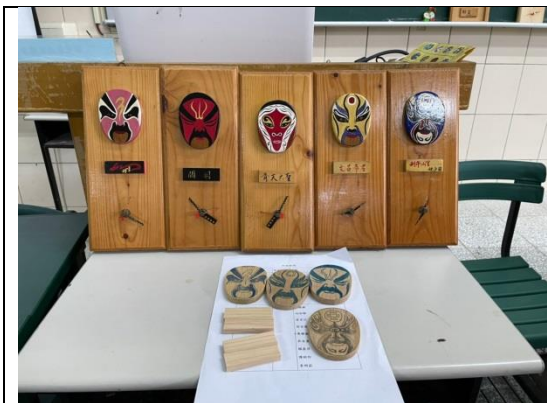
拍照日期：1100914 照片說明：時來運轉彩繪樣板