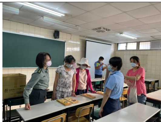
拍照日期：1100914 照片說明：作品完成後的互相討論，提升鑑賞的層次。