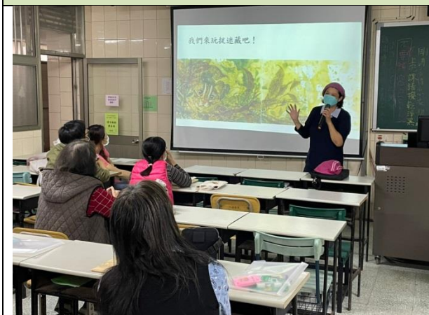
拍照日期：1101116 照片說明：從說故事媽媽開始。