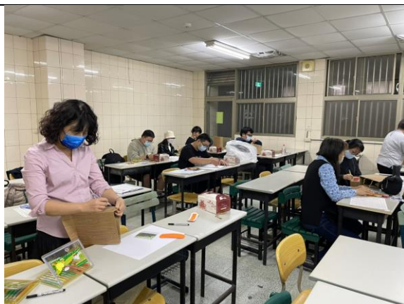
拍照日期：1101116 照片說明：原來創作不可以說自己不好，也不能批評別人，這樣我們會很放心的在自己的空間裡創作。