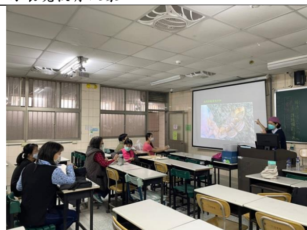
拍照日期：1101116 照片說明：少了藝術教育一代的老師，很專心的聽著、想著自己的彩色世界。