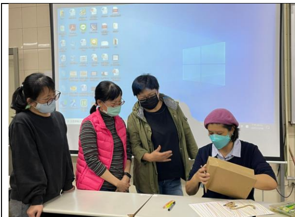
拍照日期：1101116 照片說明：動手做，最真實，勇敢畫下去就知道下一步。