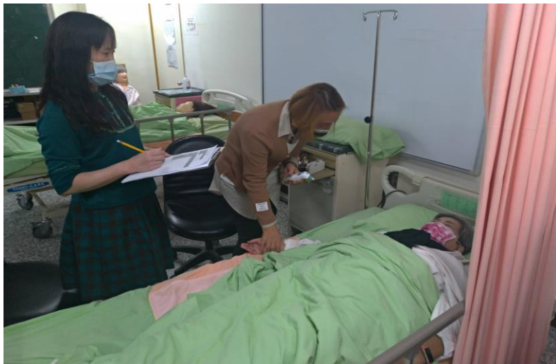
生命徵象測量-體溫