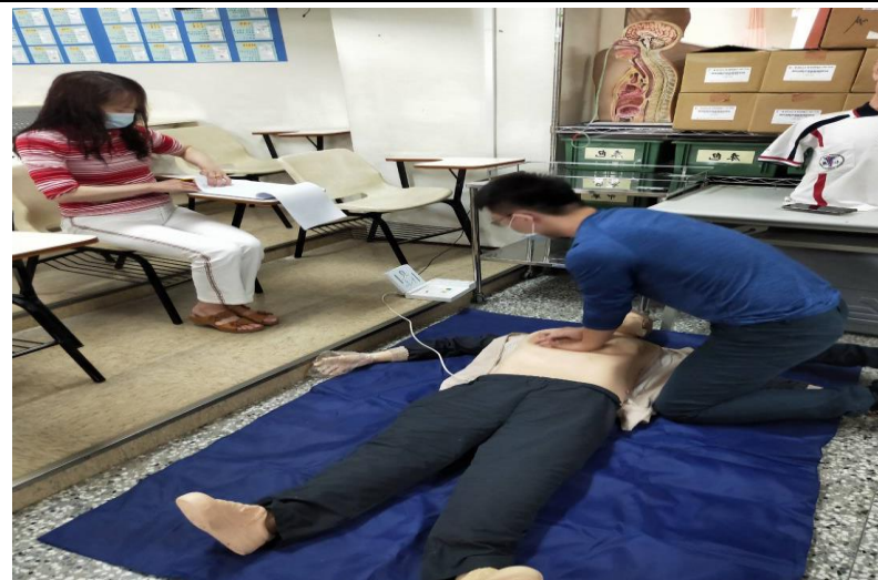
成人心肺復甦術-壓胸