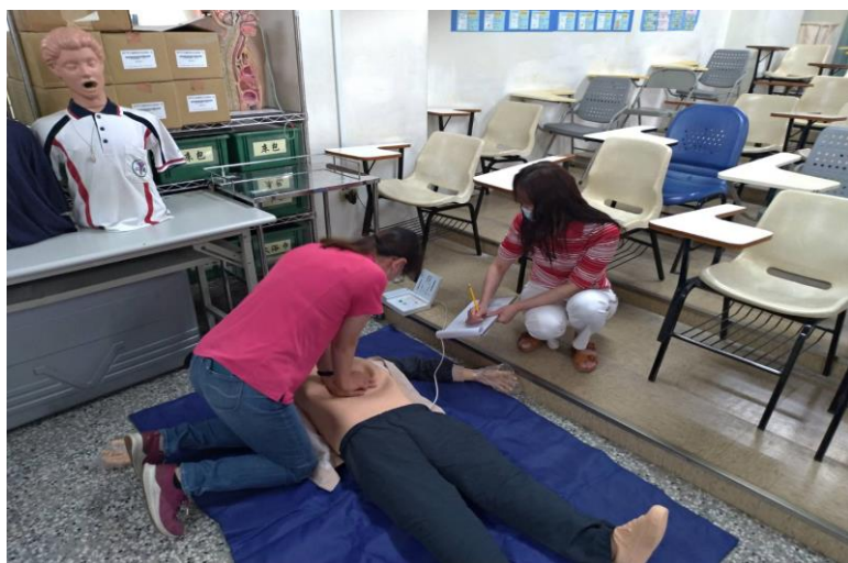
成人心肺復甦術-壓胸