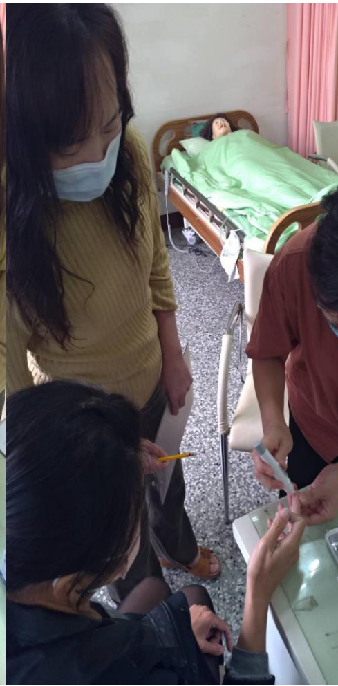
血糖測量-以採血筆穿刺採血