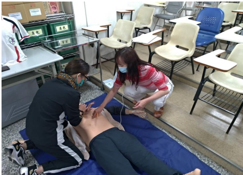
成人心肺復甦術-尋找劍突