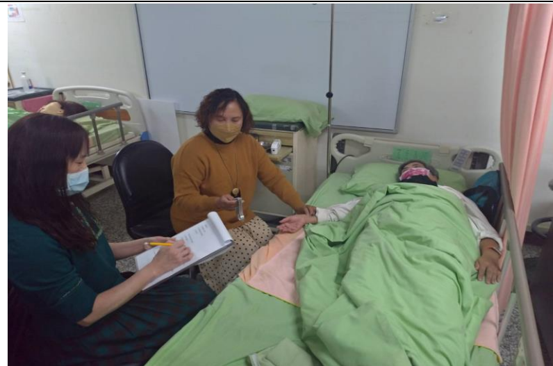
生命徵象測量-脈搏