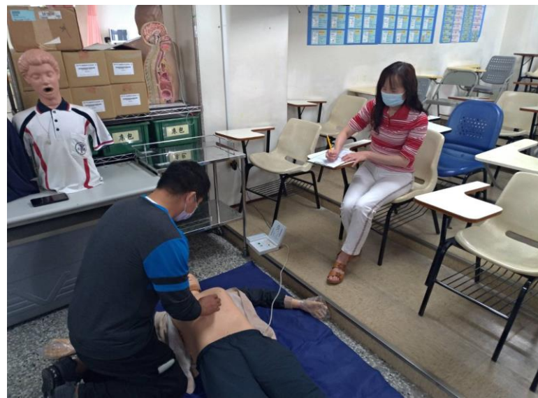
成人心肺復甦術-尋找劍突