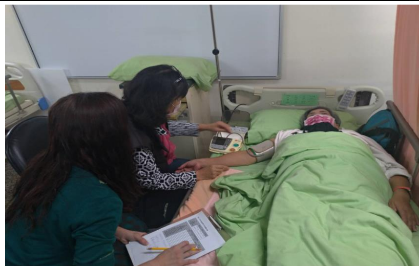
生命徵象測量-血壓