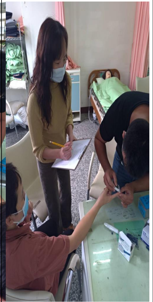
血糖測量-指根部向指尖溫和擠壓，取少量血液於測定紙上