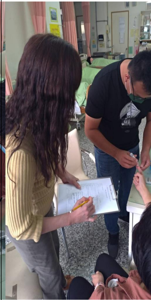
血糖測量-以採血筆穿刺採血