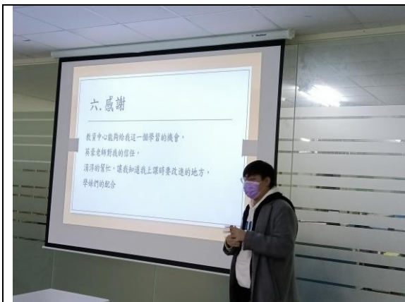
拍照日期：110年12月22日 照片說明：教學助理分享。