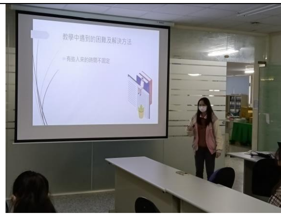
拍照日期：110年12月22日 照片說明：教學助理分享。