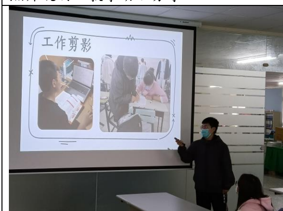
拍照日期：110年12月22日 照片說明：教學助理分享。