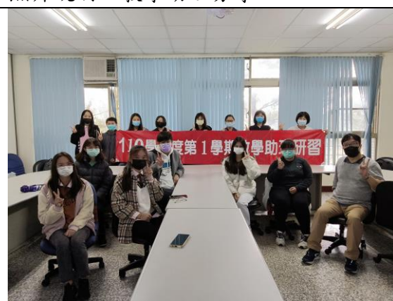
拍照日期：110年12月22日 照片說明：會後合照。