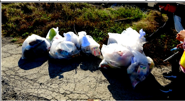
拍照日期：110 年 10 月 27 日 說明：今天的成果!請清潔隊協助處理!!