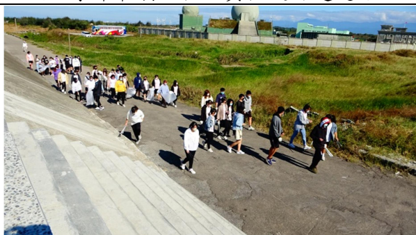
拍照日期：110 年 10 月 27 日 說明：導師帶領全班認真撿堤防邊道路垃圾 III