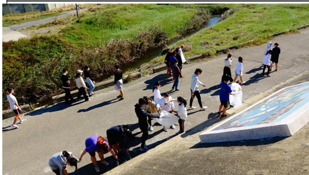
拍照日期：110 年 10 月 27 日 說明：導師帶領全班認真撿堤防邊道路垃圾 I