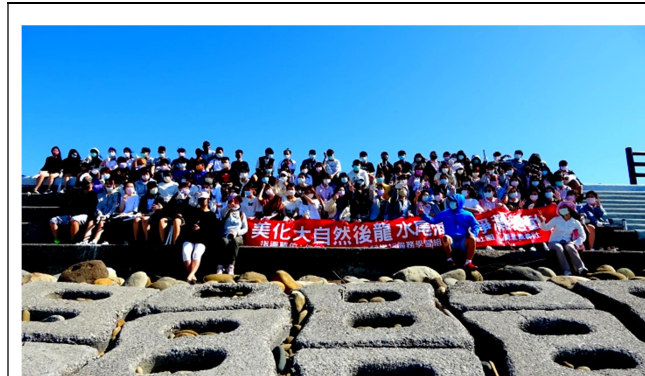
拍照日期：110 年 10 月 27 日 說明：來個石滬堤岸大合影