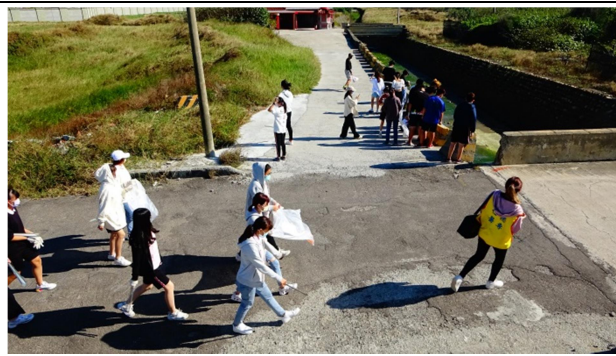
拍照日期：110 年 10 月 27 日 說明：導師帶領全班認真撿堤防邊道路垃圾 II