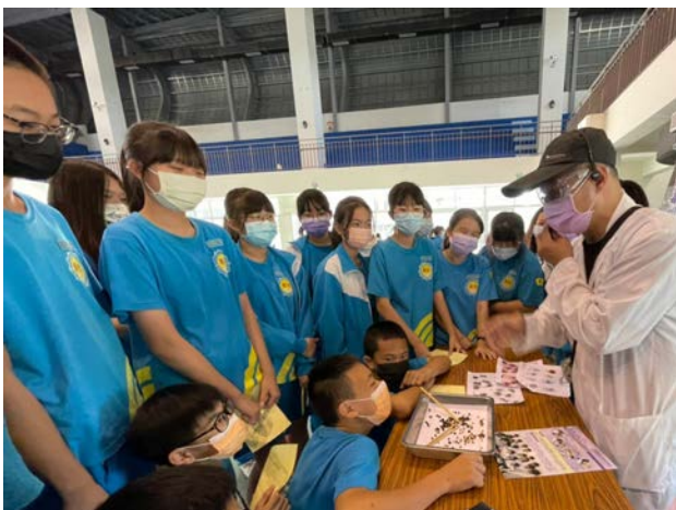
拍照日期：110年12月8日 照片說明：新光國中—二氧化硫檢測體驗