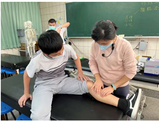
拍照日期：110年12月14日 照片說明：卓蘭高中—肌貼體驗