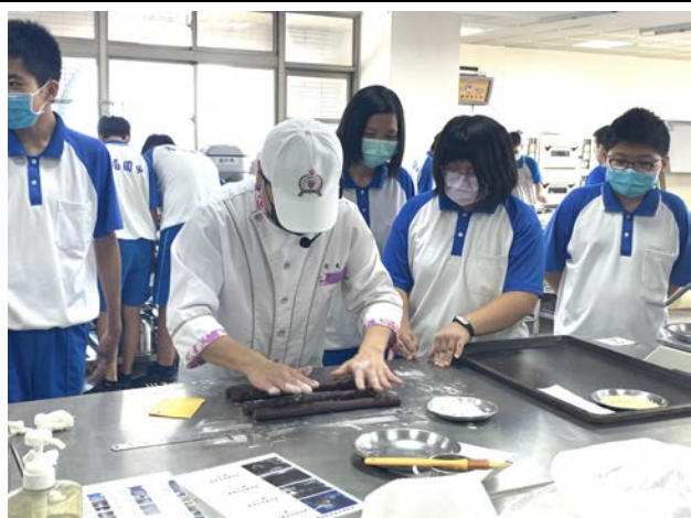
拍照日期：110 年 10 月 15 日 照片說明：烏眉國中—點心製作