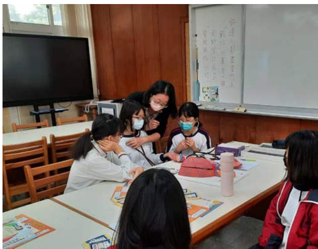
拍照日期：110年12月9日 照片說明：仁愛國中—聽見心音