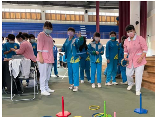
拍照日期：110年12月8日 照片說明：新光國中—老人體驗