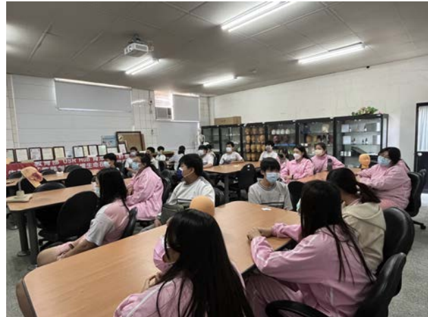
拍照日期：110年12月14日 照片說明：卓蘭高中—人生畢業典禮