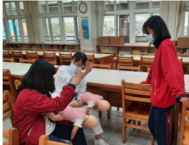
拍照日期：110年12月9日 照片說明：仁愛國中—異物哽塞