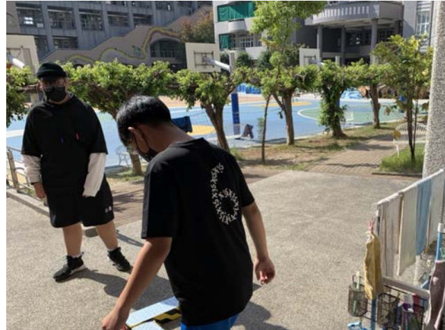
拍照日期：110年12月10日 照片說明：斗六國中-酒醉眼鏡體驗