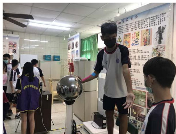
拍照日期：110 年 10 月 20 日 照片說明：維真國中—靜電體驗