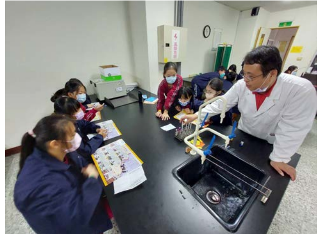
拍照日期：110年11月25日 照片說明：光華國中—血型檢測