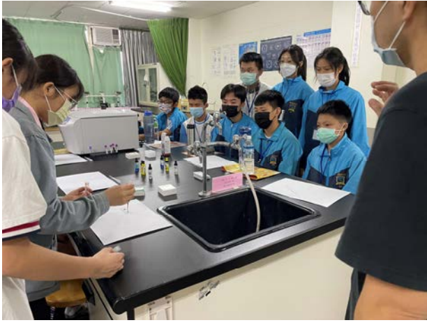
拍照日期：110年10月21日 照片說明：西苑高中—血型檢測