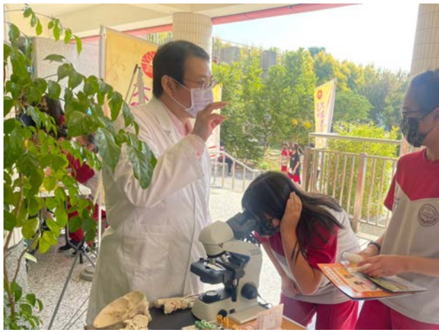
拍照日期：110年12月10日 照片說明：斗六國中-顯微鏡的世界體驗