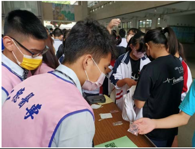
拍照日期：110年11月12日 照片說明：精誠高中—電刺激體驗