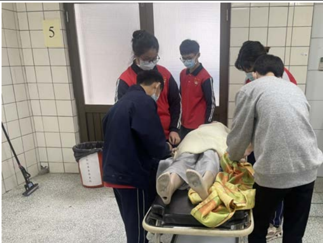
拍照日期：110年11月26日 照片說明：大湖國中—死亡體驗