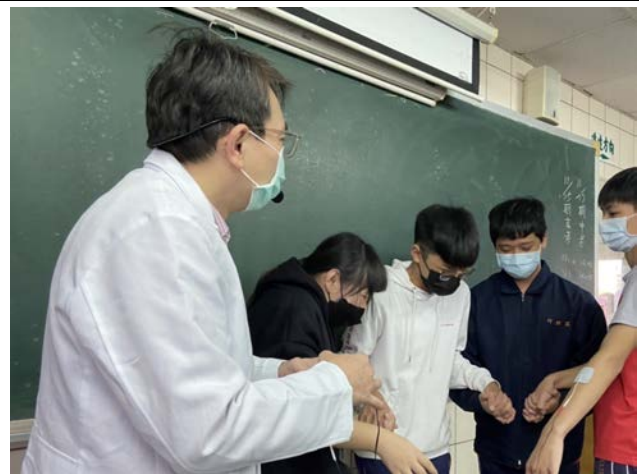
拍照日期：110年11月26日 照片說明：大湖國中—電刺激治療