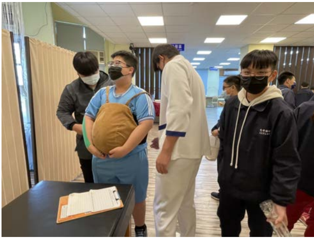
拍照日期：110年11月25日 照片說明：光華國中—孕婦體驗