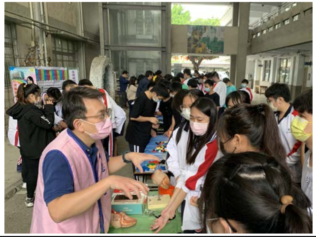
拍照日期：109年12月8日 照片說明：建國國中—生命徵象