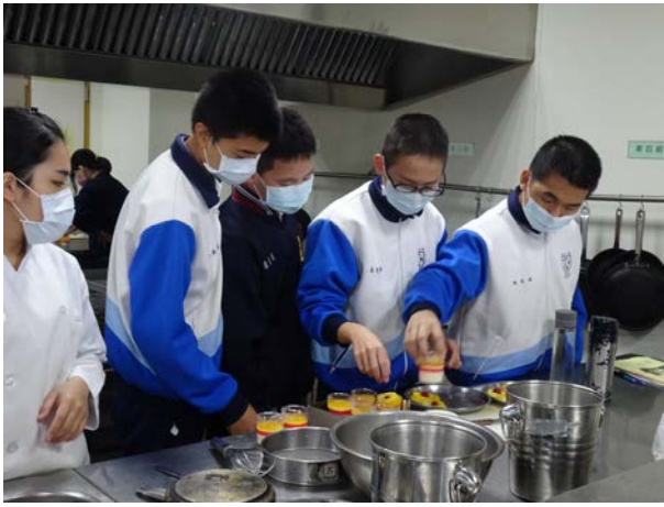
拍照日期：110年12月2日 照片說明：苗栗縣特教生—點心製作