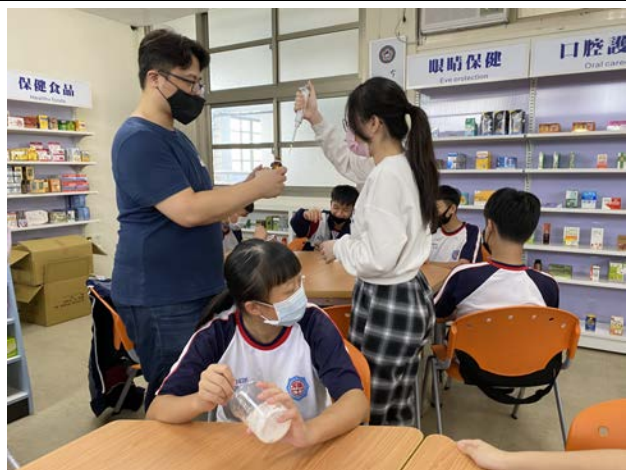
拍照日期：110 年 10 月 20 日 照片說明：維真國中—手工香皂製作