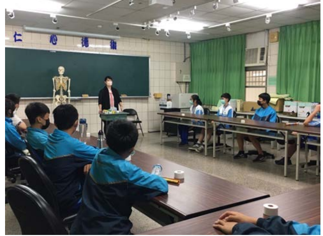
拍照日期：109年9月30日 照片說明：大雅國中—認識人體骨骼