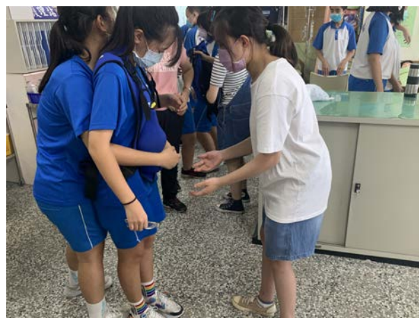
拍照日期：110 年 10 月 15 日 照片說明：烏眉國中—孕婦體驗