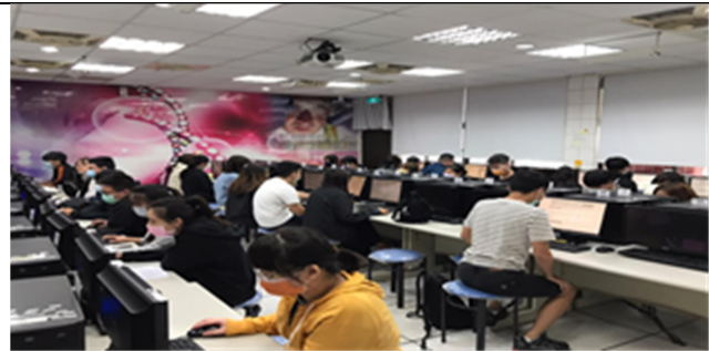
拍照時間：12:15-13:05 照片說明：物理治療5R-402線上模擬考-物理治療基礎學