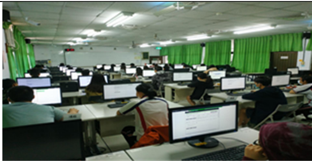
拍照時間：12:15-13:05 照片說明：物理治療5R-403線上模擬考-物理治療基礎學