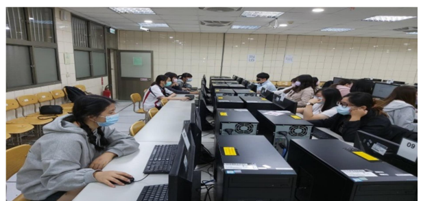
拍照時間：08:10-09:00 照片說明：職能治療實習生線上模擬考-解剖學與生理學