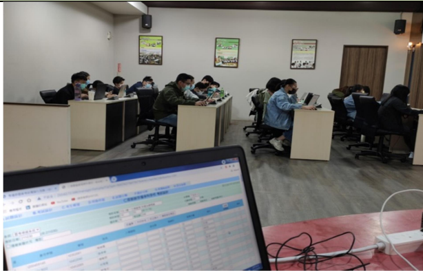
拍照時間：08:10-09:00 照片說明：物理治療實習生1線上模擬考-神經物理治療學