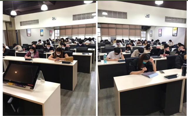
拍照時間：08:10-09:00 照片說明：物理治療實習生2線上模擬考-神經物理治療學