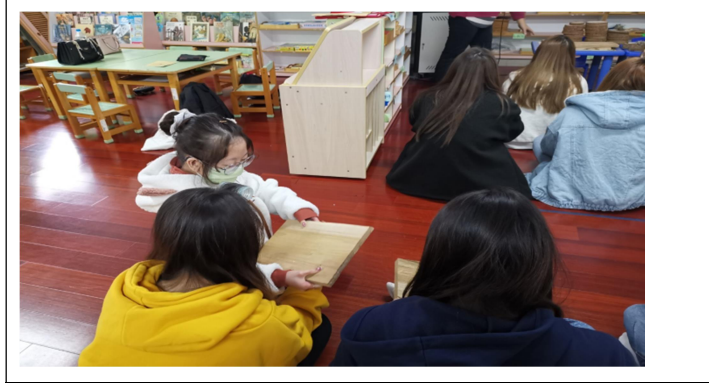
拍照日期：11/25 照片說明：透過觸覺去體驗不同材質