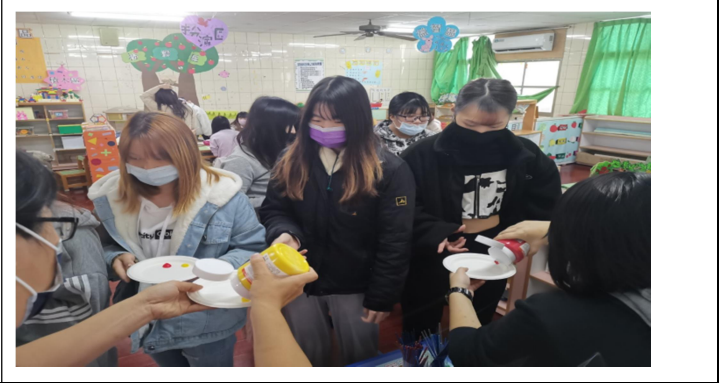
拍照日期：11/25 照片說明：彩繪木片材料運用