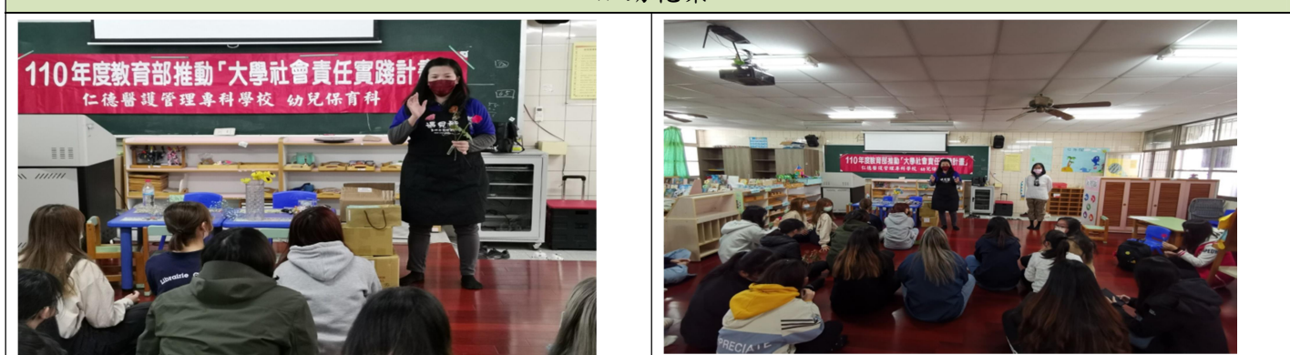
拍照日期：11/11 照片說明： 分享手作乾燥花的經驗 拍照日期：11/11 照片說明： 介紹各類型乾燥花