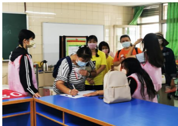
拍照日期：10/16 照片說明：參加學員報到