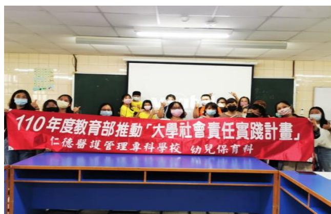
拍照日期：10/16 照片說明：行前大合照