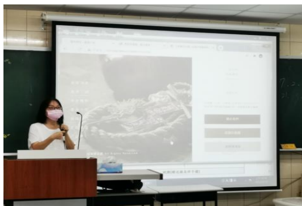
拍照日期：10/16 照片說明：行前說明會議