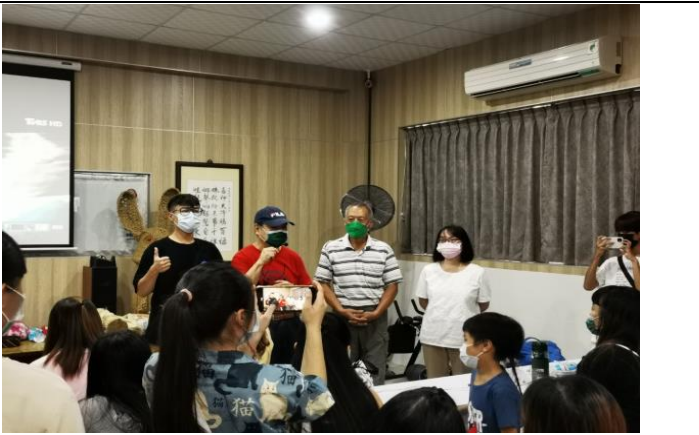
拍照日期：10/16 綜合座談