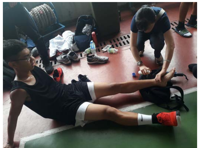
拍照日期：109 年 7 月 25 日 照片說明：健康站--三對三籃球賽高中組