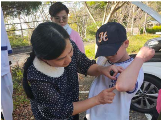
拍照日期：109年11月04日 照片說明：健康站—照南國中