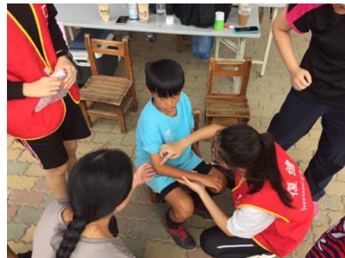
拍照日期：109 年 10 月 09 日 照片說明：健康站--區長盃足球比賽