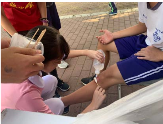
拍照日期：109年10月20日 照片說明：健康站--公館國中校慶