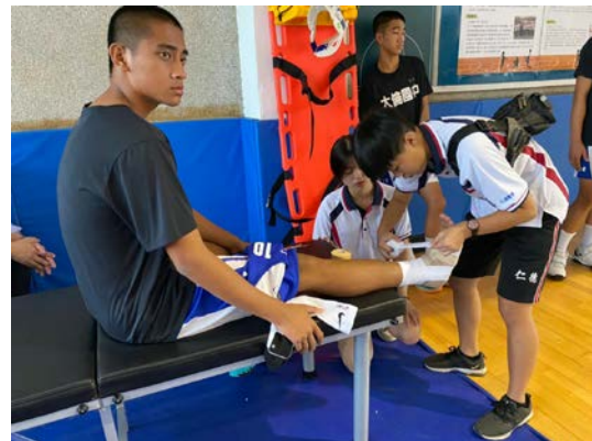
拍照日期：109年10月21日 照片說明：健康站--大倫盃全國籃球賽