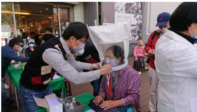
拍照日期：109年12月19日 照片說明：健康站--日月潭