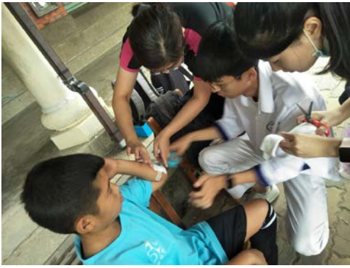
拍照日期：109年10月09日 照片說明：健康站--區長盃足球比賽