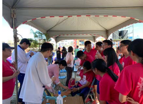
拍照日期：109年10月31日 照片說明：健康站—西湖鄉鄉長排球錦標賽