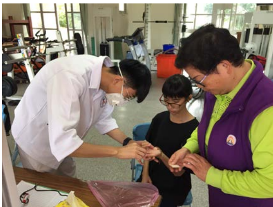
拍照日期：109年11月06日 照片說明：健康站--鶴岡國中成年禮