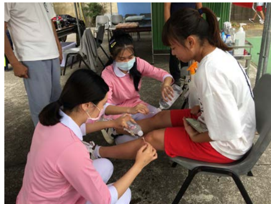
拍照日期：109年11月12日 照片說明：健康站--苗栗郵局-銀髮踏青樂遊郵