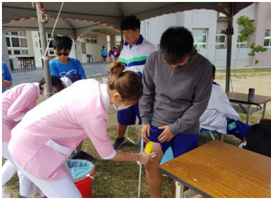
拍照日期：109年10月24-25日 照片說明：健康站—有「壺」同享風箏節