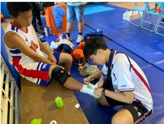
拍照日期：109年10月15日 照片說明：健康站--大倫盃全國籃球賽