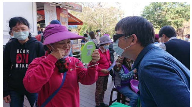
拍照日期：109年12月19日 照片說明：健康站--日月潭