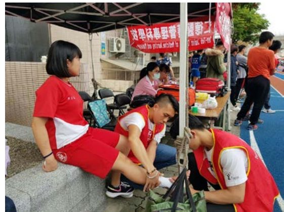
拍照日期：109年11月14日 照片說明：健康站--光榮國中