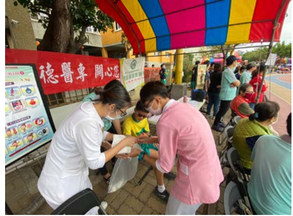
拍照日期：109年11月13日 照片說明：健康站--彰興國中