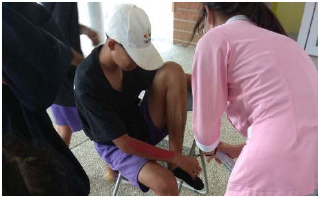
拍照日期：109年11月13日 照片說明：健康站--頭份國中