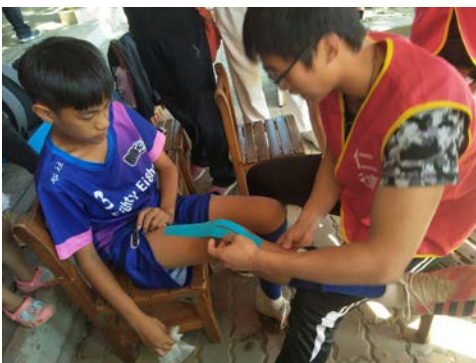
拍照日期：109 年 10 月 09 日 照片說明：健康站--區長盃足球比賽