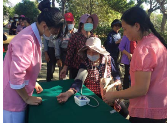
拍照日期：109年11月06日 照片說明：健康站--照南國中