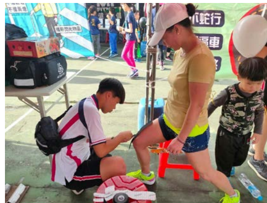
拍照日期：109年10月25日 照片說明：健康站--南庄山水馬拉松