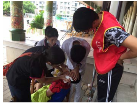
拍照日期：109年10月09日 照片說明：健康站--區長盃足球比賽