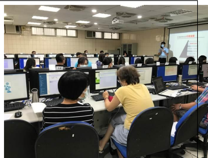
拍照日期：109.9.9 照片說明：課堂講解