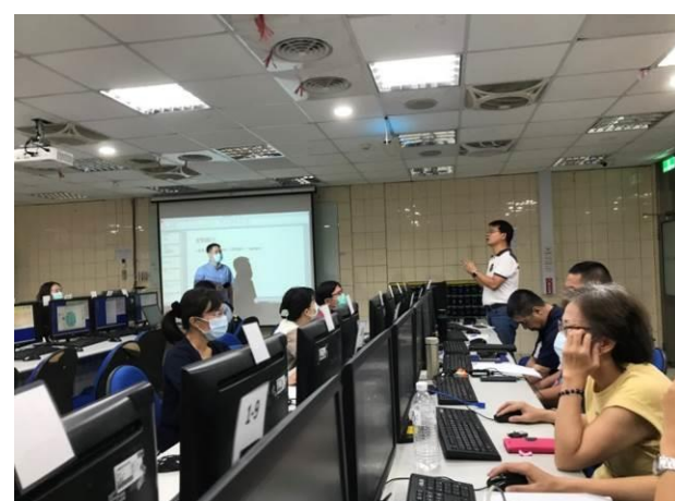
拍照日期：109.9.9 照片說明：Q&A