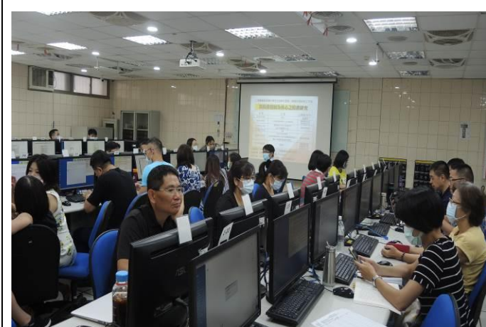
拍照日期：109.9.9 照片說明：實際操作