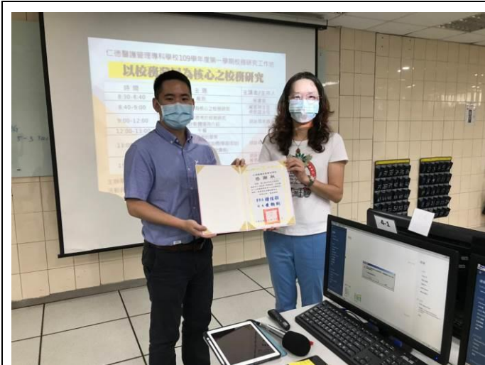
拍照日期：109.9.9 照片說明：頒發感謝狀